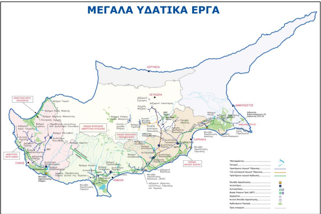
Σχήμα: Χάρτης με τα μεγάλα Υδατικά Έργα της Κυπριακής Δημοκρατίας (2021)

Η παραγωγή και προμήθεια πόσιμου νερού στην Κύπρο γίνεται κατά κύριο λόγο από τα κυβερνητικά υδατικά έργα του ΤΑΥ. Οι υδατικές εγκαταστάσεις του ΤΑΥ όπως διυλιστήρια, μονάδες αφαλάτωσης και κυβερνητικές γεωτρήσεις παρέχουν νερό μέσω κεντρικών αγωγών που διαχειρίζεται το ΤΑΥ και μεταφέρουν το νερό από τις πηγές υδροδότησης σε δεξαμενές αποθήκευσης. Ακολουθώντας το νερό μεταφέρεται μέσω τροφοδοτικών αγωγών είτε στις δεξαμενές αποθήκευσης στις κεφαλές των δικτύων διανομής των φορέων ύδρευσης είτε απευθείας στα δίκτυα διανομής τους. Στον πιο κάτω χάρτη παρουσιάζεται η τοποθεσία των διυλιστηρίων, μεγάλων φραγμάτων και μονάδων αφαλάτωσης, καθώς και οι υφιστάμενοι και υπό κατασκευή αγωγοί του συστήματος υδροδότησης των μεγάλων υδατικών έργων του ΤΑΥ.